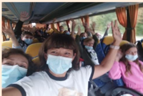
Četvrtaši u autobusu na putu za Karlovac uz pridržavanje epidemioloških mjera.

posjećuju Gospić, Memorijalni centar Nikole Tesle u Smiljanu, Veliki Žitnik, dolinu Gacke i Otočac, a posebni razredni odjel posjećuje Gradsku knjižnicu u Sesvetama.