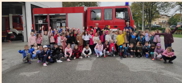
DVD Sesvete i drugašići.