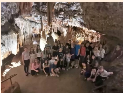
Sedmaši u Jami Baredine

Za učenike osmih razreda organizirali smo višednevnu terensku nastavu u Dalmaciju s izletima u Trogir, Split, Šibenik, Sokolarski centar, Pakovo selo i Zadar. Prvašići su posjetili Zoološki vrt i konjički klub Don Kihot, šestaši su bili na Krku, a petaši i sedmaši u Istri gdje su posjetili zvezdarnicu u Tićanu, Jamu Baredine, Hum, Roč i Aleju glagoljaša.