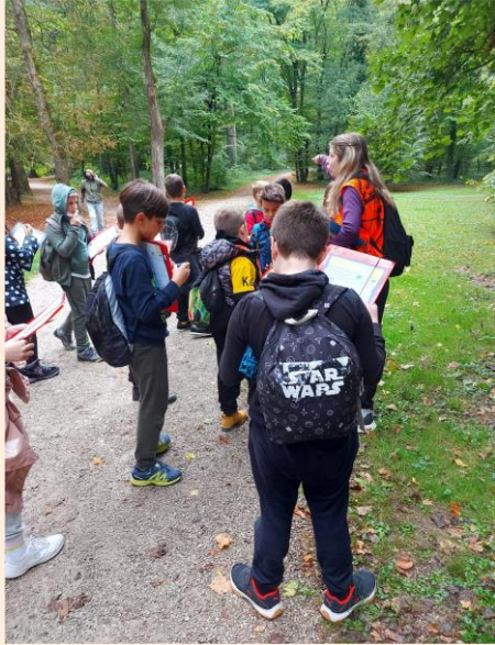
Trećaši u Parku Maksimir.