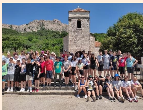
Šestaši na Krku