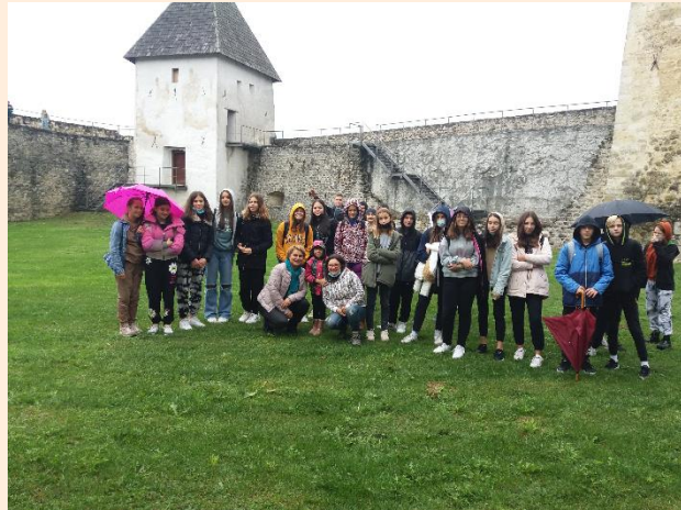
Mladi planinari u Hrvatskoj Kostajnici.