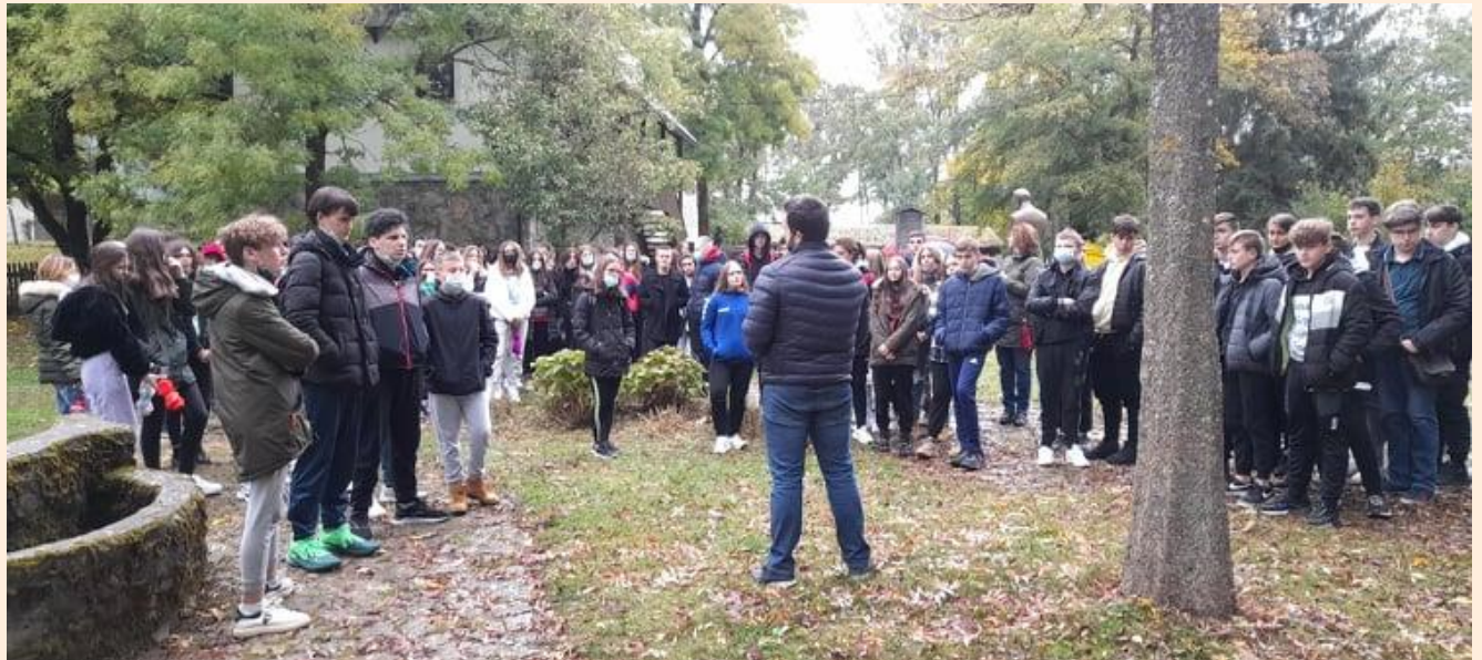
Osmaši u Lici.