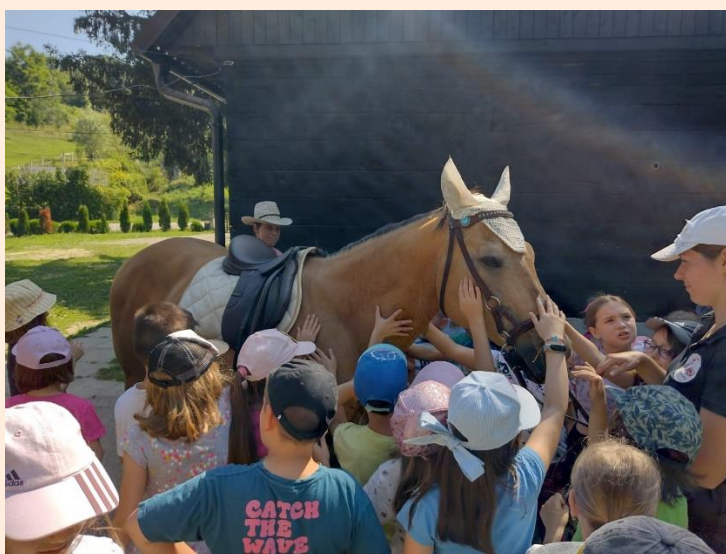
Prvašići u konjičkom klubu